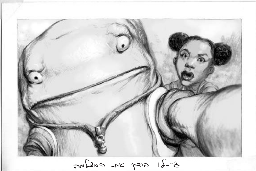
ג'יי-אן בובק את המצחקה

"כן, השבתי נחרצות. היא התגלגלה. על הקרקע." הבוב הקדיש לכך מחשבה ארוכה. "אבל... איך היא להתגלגל עם הצמיג המפונצ'ר הזה?" הנחתי את הסל והתיישבתי. "לא משנה," אמרתי. "טוב," השיב הבוב. "עכשיו היא לרחף משהו סופני. אני להשתמש בחלקים של מתוך הרכב שלי." קצת נבהלתי פתאום מאיך שהוא אמר "משהו סופני." זה היה סלנג. לא ציפיתי ממנו לדבר ככה. ואפילו לא סלנג פופולרי. אף אחד כבר לא משתמש בזה יותר. אף אחד חוץ מאמא שלי ולפעמים גם אני. כנראה זה הזכיר לי את אמא שלי, וכנראה זה קצת הרגיז אותי. "תאכל את החוט הדנטלי שלך, בוב," אמרתי ובעטתי את הסל לכיוונו. נראה שהוא לא התרגש מהעניין ועשה כדברי, שואב את החוט כמו ספגטי. "את לא לומר את זה נכון," אמר כשסיים. "לומר מה?" "'בוב.' איך שאת לומר את זה, זה קצר מדי. את להצטרך להאריך את הצליל, כמו נשימה ארוכה. 'בוב-אוי-בוב.'"