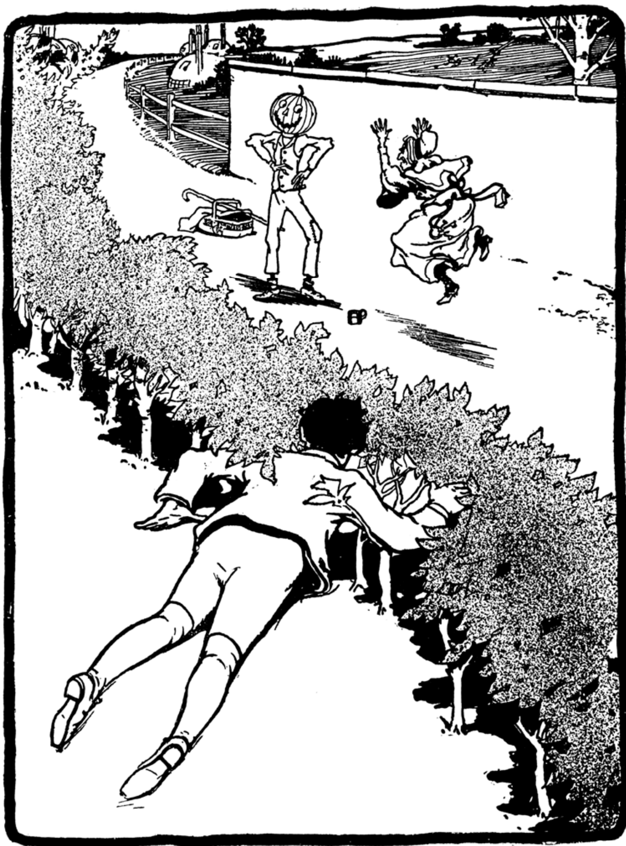
מומבי הזקנה רקדה סביבו